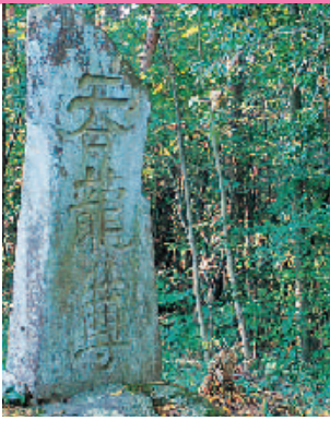
どなりゅうのみこと ■呑龍尊

蓼科の裾野から流れる宇山堰の竣工を祝して祭祀し、早魃や冷害の鎮座の神として崇拝されている。