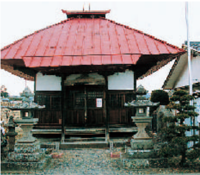
■日限地蔵尊 諸病祈願の日限を定めれば、その祈願日には必ず全快するとのこと。