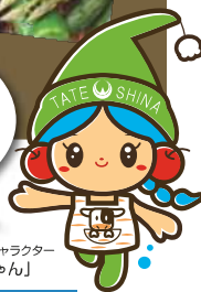
立科町マスコットキャラクター 「しーなちゃん」