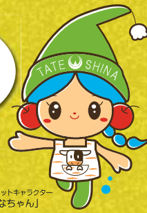
立科町マスコットキャラクター 「しいなちゃん」