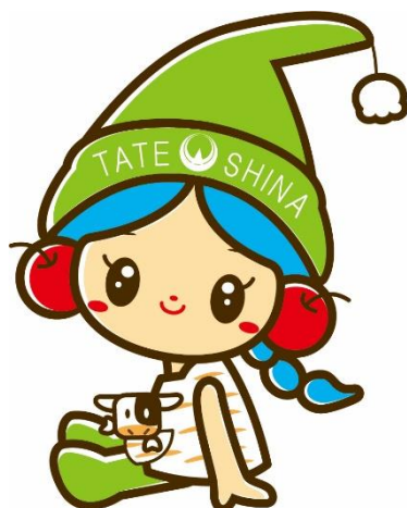
立科町マスコットキャラクター