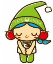
立科町マスコットキャラクター しいなちゃん