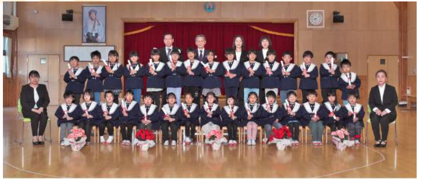
令和7年度 立科町たてしな保育園 卒園記念 年長 きりん組 2026.3.31