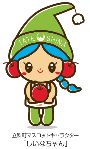
立科町マスコットキャラクター「しいなちゃん」