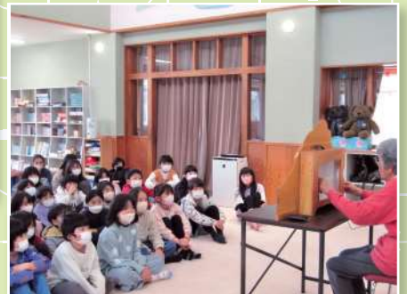
「読み聞かせ(紙芝居)」

・日曜日は町内在住の未就学児とその保護者を対象に、午前10時～午後5時まで開館しています。ご利用を希望される場合は、利用希望日の2週間前までに児童館に申込みをしてください。