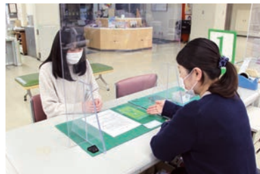
2 カード送付等のご案内