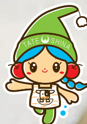
立科町マスコットキャラクター 「しいなちゃん」