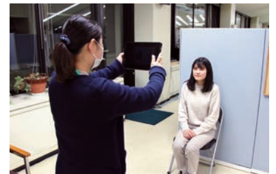
3 タブレット型端末による 写真撮影・確認