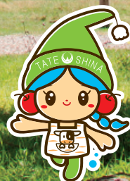
立科町マスコットキャラクター 「しいなちゃん」