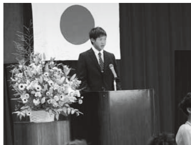
新成人代表あいさつ