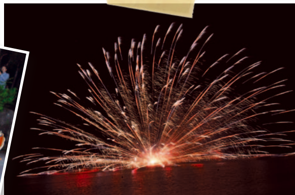
水中スターマイン