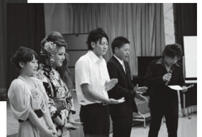
成人式実行委員会のみなさん