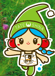
立科町マスコットキャラクター 「しいなちゃん」