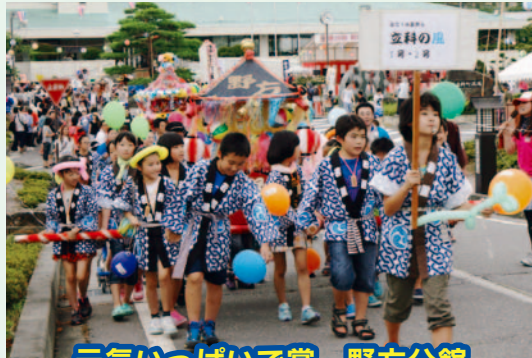
元気いっぱい賞 野方分館