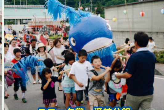
ユニーク賞 滝神分館