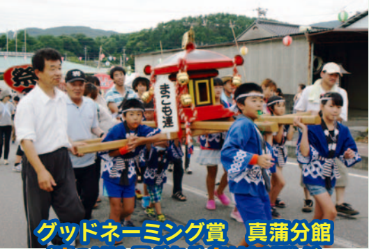
グッドネーミング賞 真蒲分館 (まつりはこどもがもりあげ隊!)