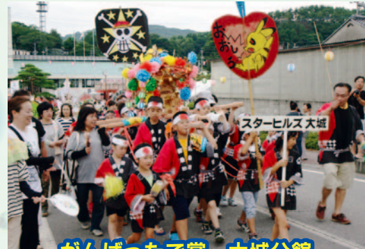
がんばったで賞 大城分館