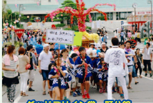
グッドデザイン賞 町分館