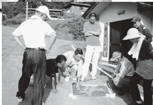
災害危険箇所確認