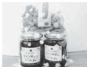
ワイン葡萄ジャムとかりんとうのセット