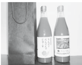
りんごのにんじんジュースセット