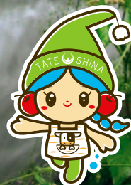
立科町マスコットキャラクター 「しいなちゃん」