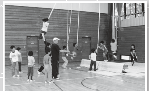
学習・スポーツ教室