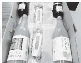
りんごのにんじんジュース・ かりんとう・ワイン葡萄ジャムのセット