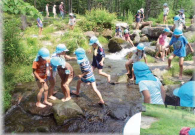
7月26日(金) 蓼科の自然を満喫できた 「自然観察」 “牧場で動物とのふれあい” “御泉水の 水の冷たさを肌で感じた”