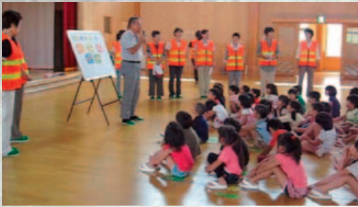
7月25日(木) 川西防犯女性部の皆さんが訪問 “知らない人にはついていかない！”