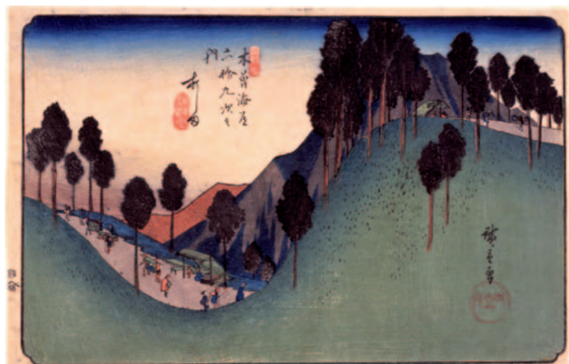
『木曾海道六拾九次之内』の「式拾七 あし田」

そこで、2回に分けて、笠取峠のマツ並木保存管理計画書のコラム「広重が描いた笠取峠の松並木」において「浮世絵風景画(名所絵)に描かれる景観」の視点から図柄の取り違えが検証されていることを紹介します。