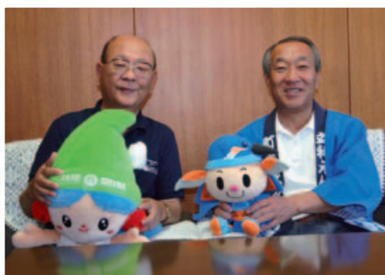
左側；山田町長、右側：小宮山町長

友好都市である「愛川町」とは多くの交流事業が行われており、今後、秋の「愛川町ふるさとまつり」や、冬の「愛川町一周駅伝競走大会」にも参加する予定です。