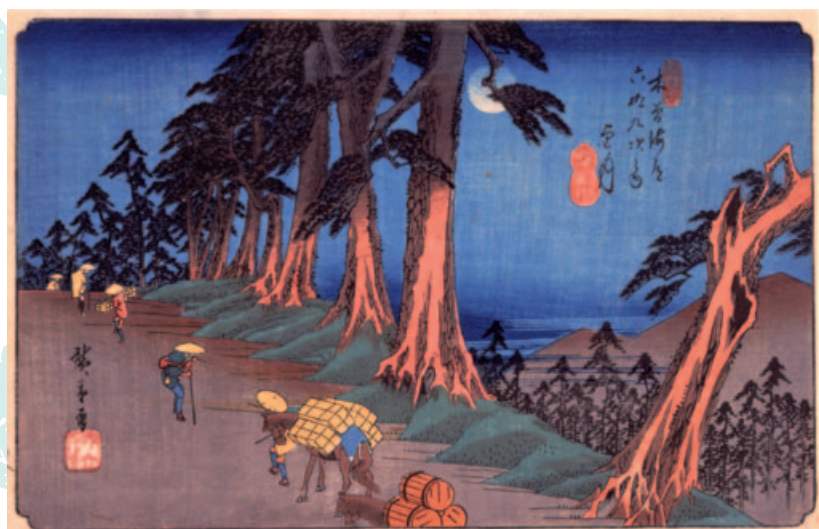
『木曾海道六拾九次之内』の「式拾六 望月」 財団法人 中山道広重美術館所蔵

今回は、広重が佐久地方の作品群に描いた主題はどんなものか考えてみます。 「望月」では、画面左端に透視遠近法の消失点が設定され、そこに収斂する旅人のラインと松の梢のラインが構図を規定しています。これを見る限り、「峠と松並木」が主題だとしか解釈のしようがありません。