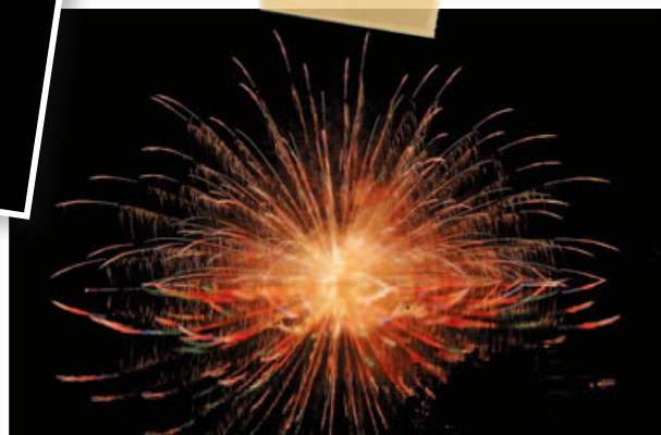
水中スターメイン