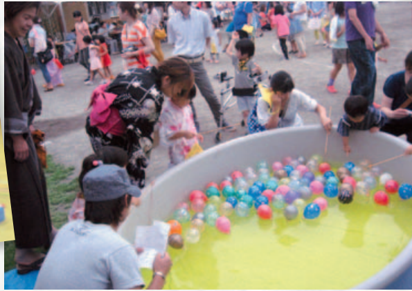
8月8日(木) 親子で夏の 夜のひとときを楽しく過 ごした「夏祭り」 “御泉水太鼓ジュニアチー ムの演奏” “お祭り広場 (おばけ迷路他)” “盆踊り” “花火大会”