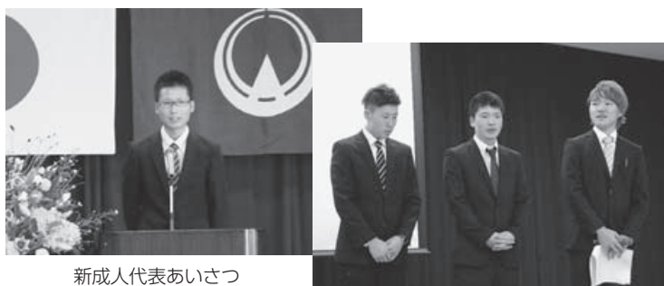
新成人代表あいさつ

新成人の皆さんからは、希望に満ちた活気あるエネルギーを感じました。前途洋々たる皆さんのますますのご活躍を期待しています。