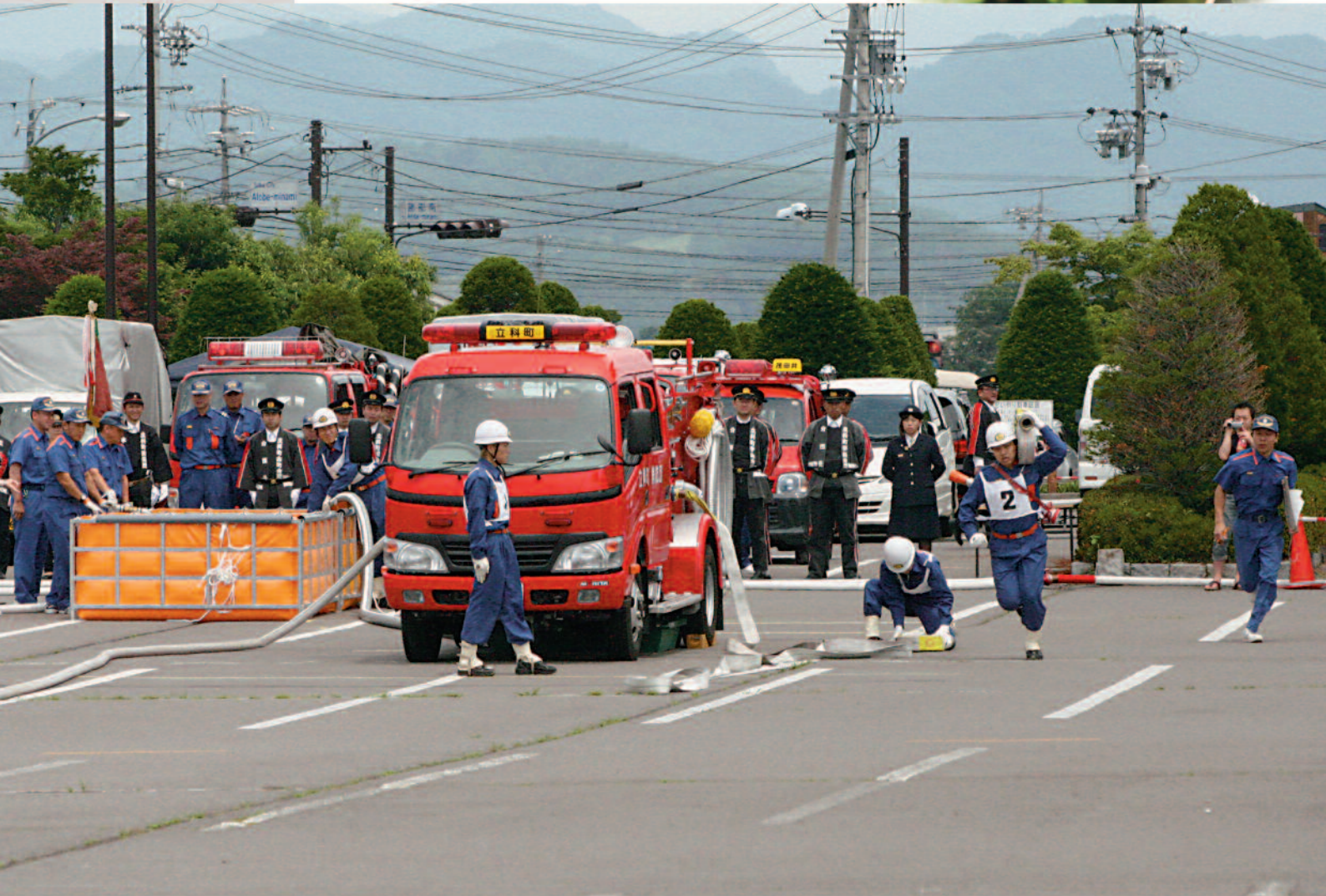
7月3日(日) 北佐久消防協会ポンプ操法大会