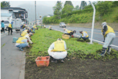
国道45号 浪板海岸沿いの花壇を整地