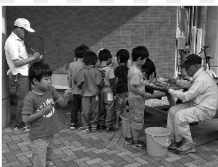
竹筒で紙鉄砲づくり