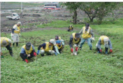
瓦礫の中、広大なひまわり畑の除草作業に精を出す