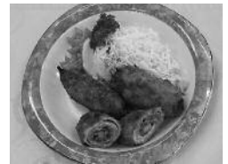
第1回創作郷土料理の部最優秀賞 (たてしな豚 とんとん おやきロール)

第2回となる立科の味「料理コンテスト」を次のとおり開催します。地域の農林畜産物等を用いて創作した自慢の料理を、ぜひ応募してください。(プロ・アマは問いません)