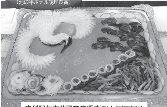
立科野菜中華風辛味醤油漬け (写真右側) 白樺リゾート池の平ホテル 中華部門