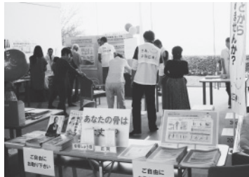
(※2014年9月開催時の様子)

「骨粗しょう症」と「ロコモティブシンドローム」の予防をテーマに、ロコモ度チェックコーナーや、骨粗しょう症やロコモティブシンドロームへの理解を深めるためのクイズコーナーなどを設け、体を動かしながら、気軽に楽しく病気の予防について知っていただけます。また、各コーナーをまわって、アンケートにご回答いただいた方の中から、抽選で記念品をプレゼントします。