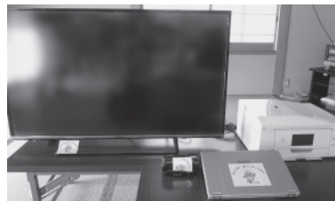
(液晶テレビ・デジタルビデオカメラ・パソコン・プリンター)

宝くじの収益金を活用した一般コミュニティ助成事業は、地域住民の連帯感や自治意識を盛り上げることが目的の地域コミュニティ活動に必要な施設整備等が対象となります。