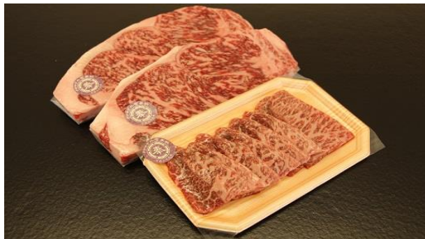
蓼科牛サーロインステーキ200g×2・焼肉150g(焼肉150gは、ウデ(肩)、バラ、モモのいずれか (写真はウデ))