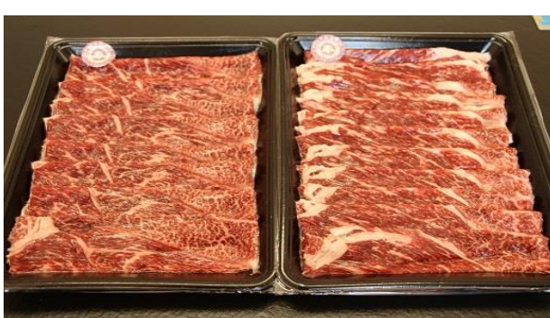
蓼科牛ウデすき焼き400g×2