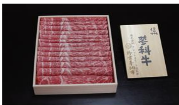
蓼科牛リブローズしゃぶしゃぶ500g