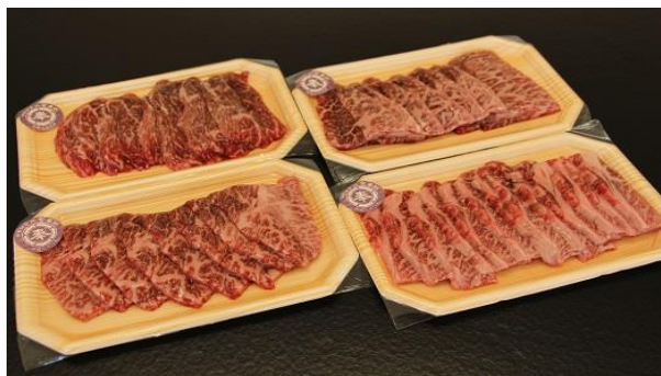
蓼科牛焼肉150g 4点セット (バラ×1、モモ×1、ウデ×2)