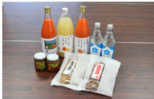
立科うまいものセット(りんごジュース、にんじんジュース、 立科サイダー、辛みそ、りんごかりんとう、そばかりんとう)