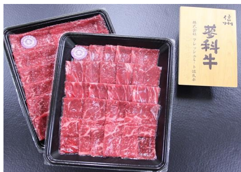
信州 蓼科牛 焼肉用・すき焼き用セット (焼肉用350g・すき焼き用400g)